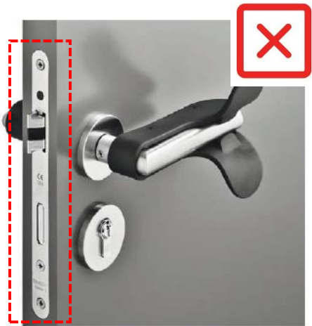
ตลับมอทีสล็อค