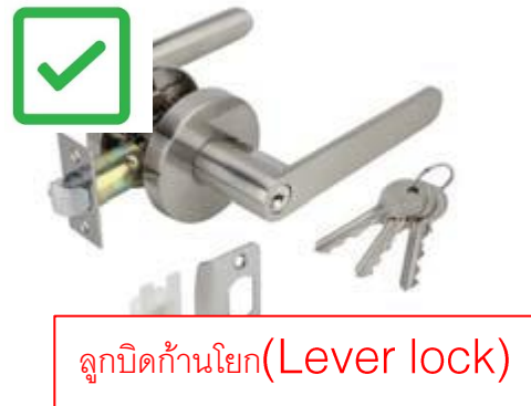
ลูกบิดก้านโยก(Lever lock)